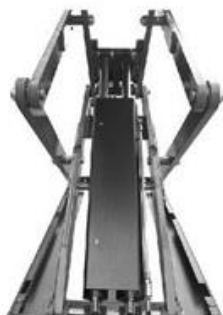
* podwójny system podnoszenia (2 siłowniki)