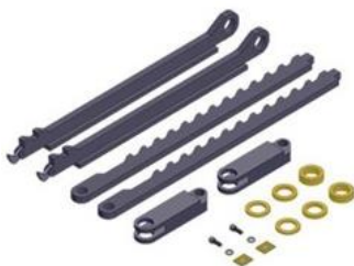
* blokada mechaniczna (opcja)